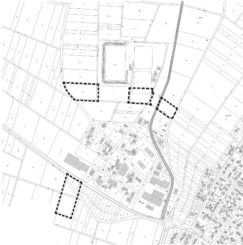
Lageplan mit Änderungsbereichen (ohne Maßstab)

Die Änderungsbereiche ergeben sich aus folgenden Planausschnitten: